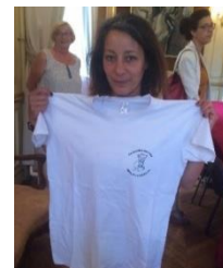
T-shirt du conseil citoyen des Bouttières à Grand-Couronne pour être mieux identifié par les habitants du quartier

Nombreux sont ceux également qui se sont investis dans l'organisation et la participation à des événements conviviaux sur leur quartier pour favoriser le mieux vivre ensemble : 7 dans des fêtes de quartier (La Tourfaudière à Avranches, Perseigne et Courteille à Alençon, Lalizel à Barentin, Maupas-Haut-Marais-Brèche du bois à Chebourg en Cotentin, Grand Couronne et Thorez Grimau à Saint-Etienne-du-Rouvray), ou au Carnaval (Buisson-Gallouen à Sotteville-Lès-Rouen) et La Tourfaudière à Avranches a également contribué à une fête des voisins . Les conseils citoyens d'Argentan projettent également de contribuer à ce type d'évènement dans les mois à venir.