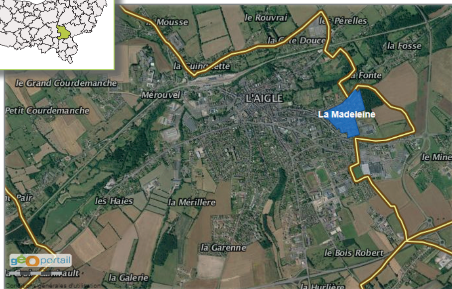
Données cartographiques : © FEDER, Région Normandie, IGN, ANCT