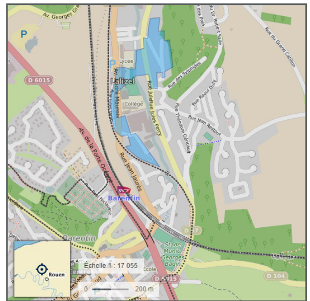
Carte de situation du quartier