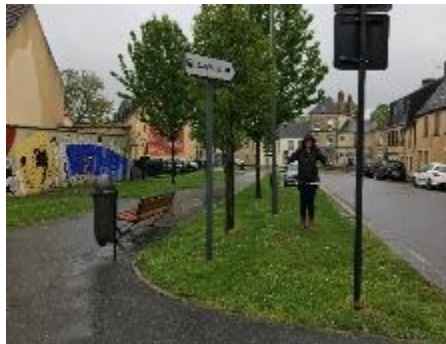
fresque à côté de l'hôpital