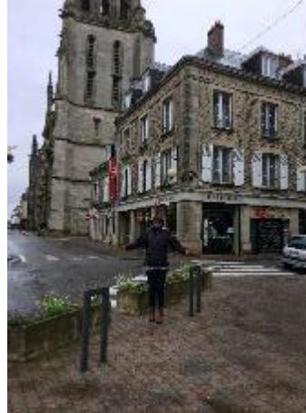
Place Henri IV droite