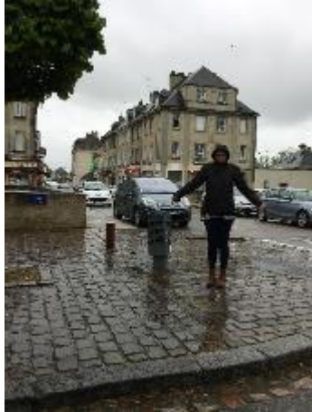
Place de Lattre Tassigny