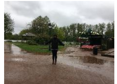
Plan d'eau coté rue Charlotte Corday