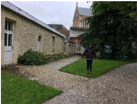
Local du Conseil Citoyen (Médiathèque)