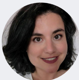
Table ronde : Quels leviers urbains pour une inclusion durable dans les quartiers ?

Chercheuse sur les dynamiques de dégradation et d'amélioration du cadre de vie urbain, elle défend une approche fondée sur le dialogue entre bailleurs, collectivités et habitants. Ses travaux portent sur la gestion des espaces partagés, la perception de la qualité de vie et les coopérations nécessaires pour agir durablement dans les quartiers.