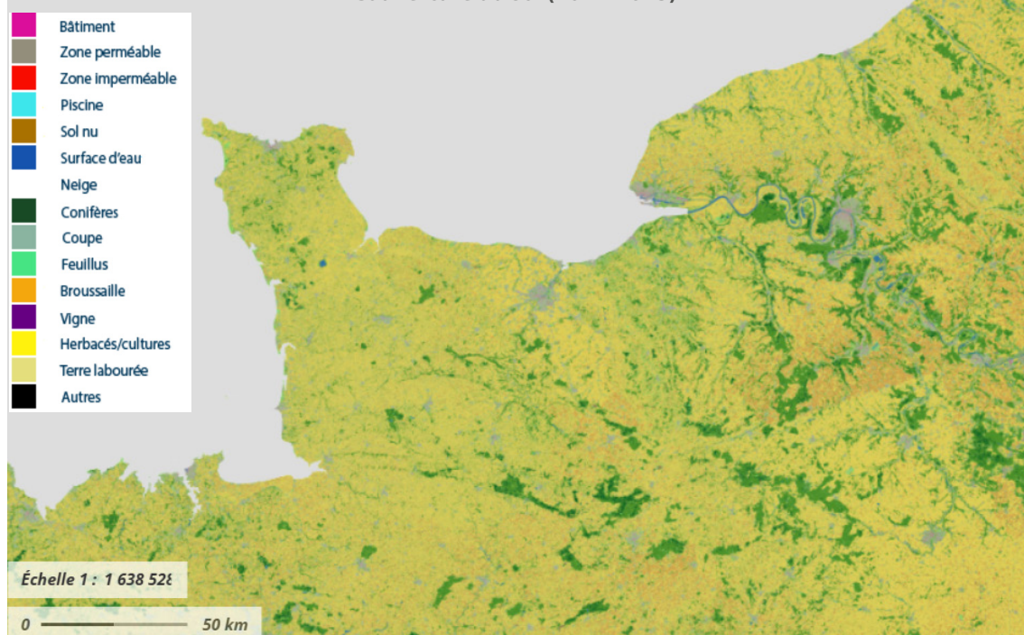
Couverture du sol (2021-2023)

Retrouvez la typologie de l'occupation des sols de l'EPCI sur le portail national de la connaissance du territoire mis en œuvre par l'IGN : https://www.geoportail.gouv.fr/carte